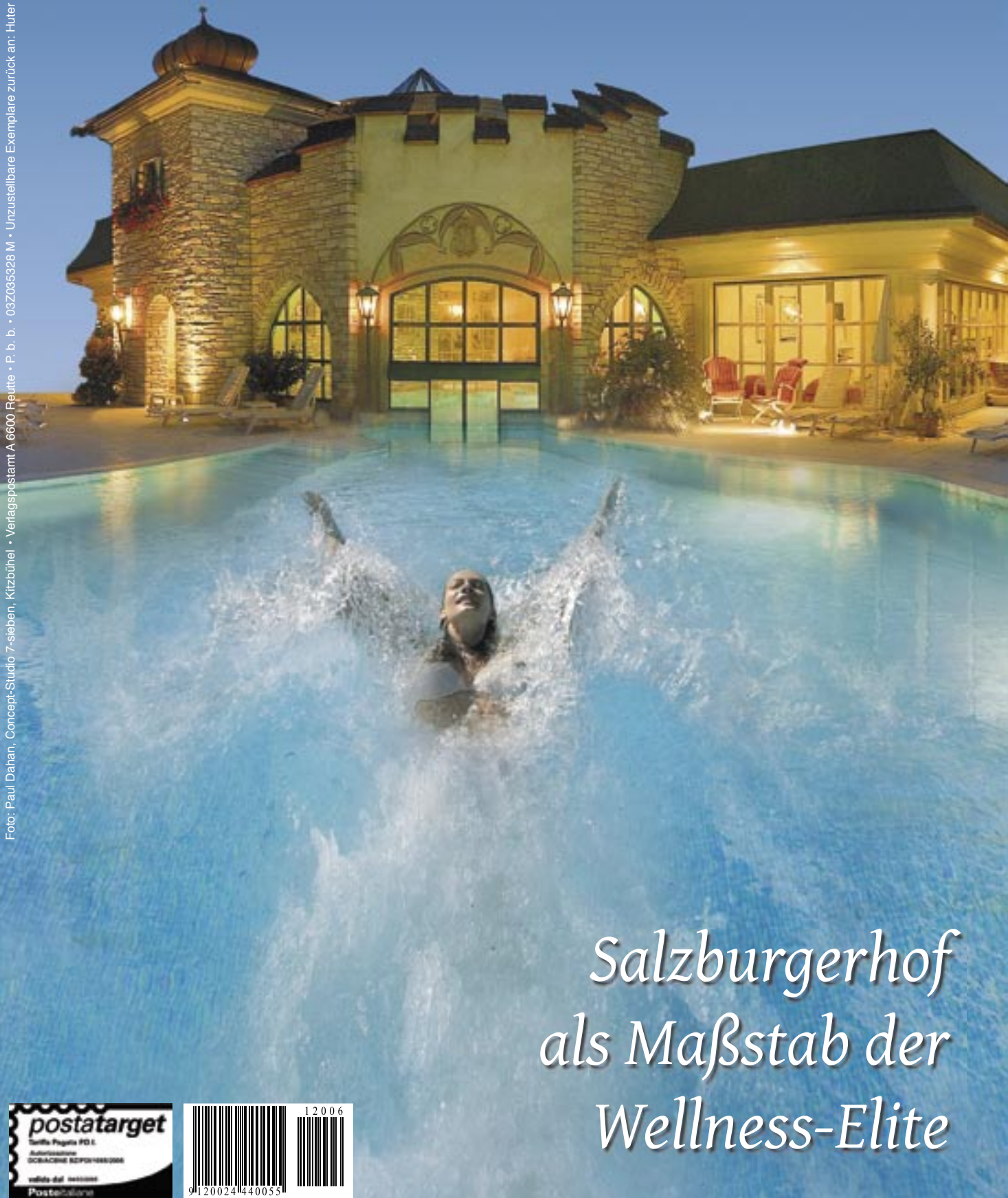
Foto: Paul Dahan, Concept-Studio 7-sieben, Kitzbühel • Verlagspostamt A 6600 Reutte • P. b. • 03Z035328 M • Unzustellbare Exemplare zurück an: Huter & Klimesch GmbR, Lindenstraße 25 / 11, 6600 Reutte

Salzburgerhof als Maßstab der Wellness-Elite