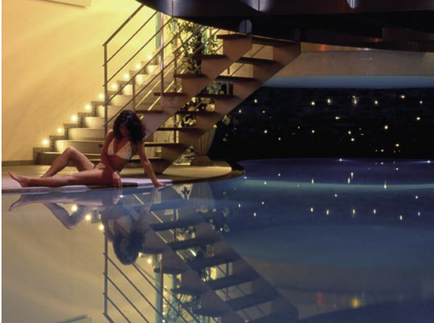
Italienisches Flair im Panoramaschwimmbad des Hotel „Monzoni“.