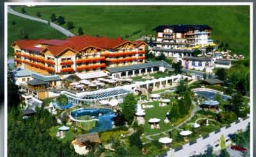
Oberforsthof – Urlaub auf höchster Ebene.